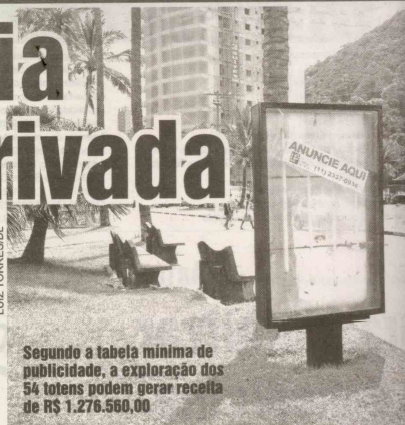
Segundo a tabela mínima de publicidade, a exploração dos 54 totens podem gerar receita de R$ 1.276.560,00